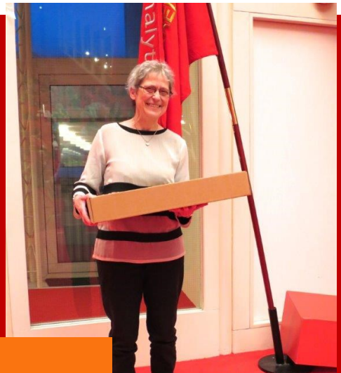
50 års jubilar