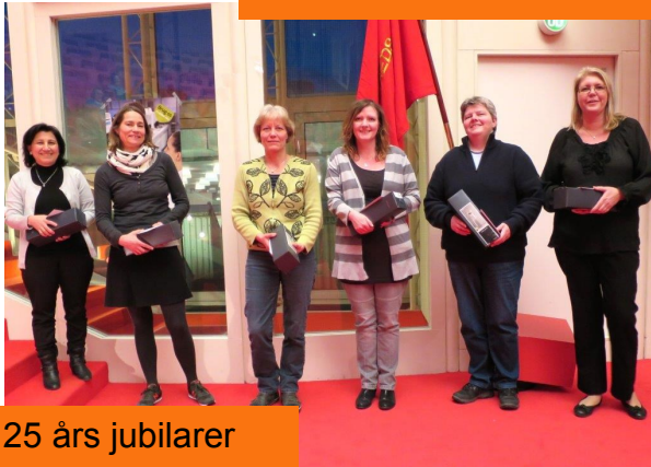
25 års jubilarer