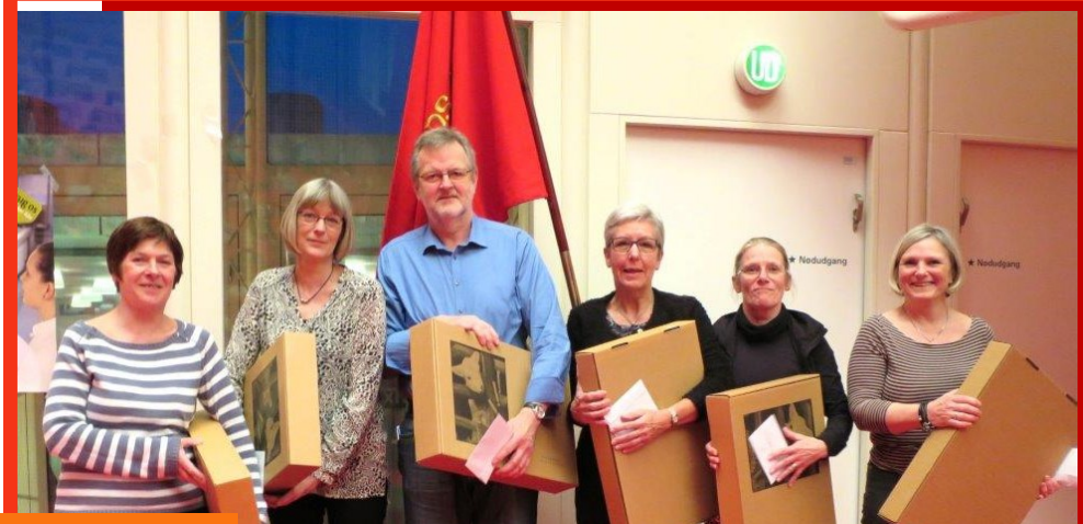
40 års jubilarer