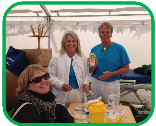
Folkemødet på Bornholm