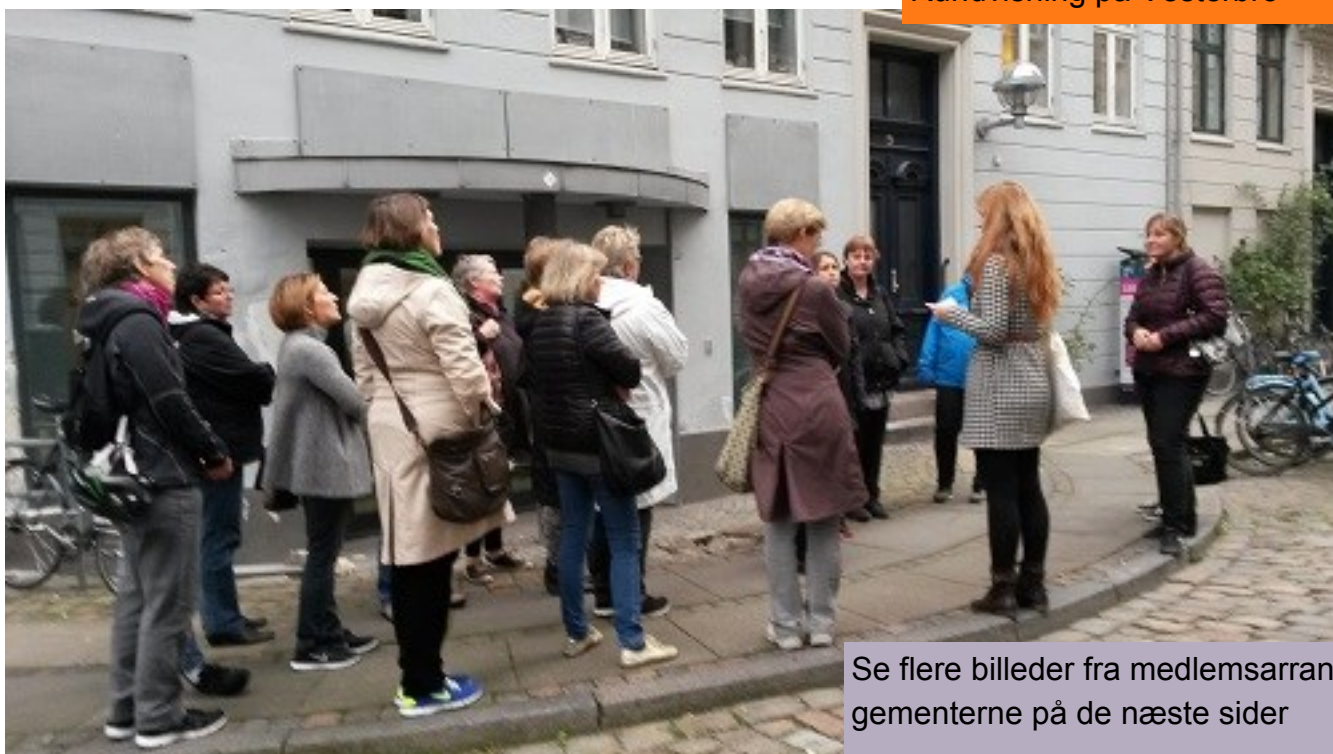
Rundvisning på Vesterbro

Se flere billeder fra medlemsarrangementerne på de næste sider